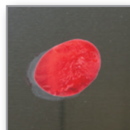
④温度が下がり再結晶化