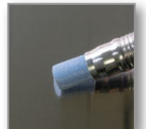
① 定格温度以下では融解なし