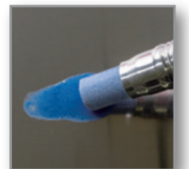
② 定格温度以上で融解